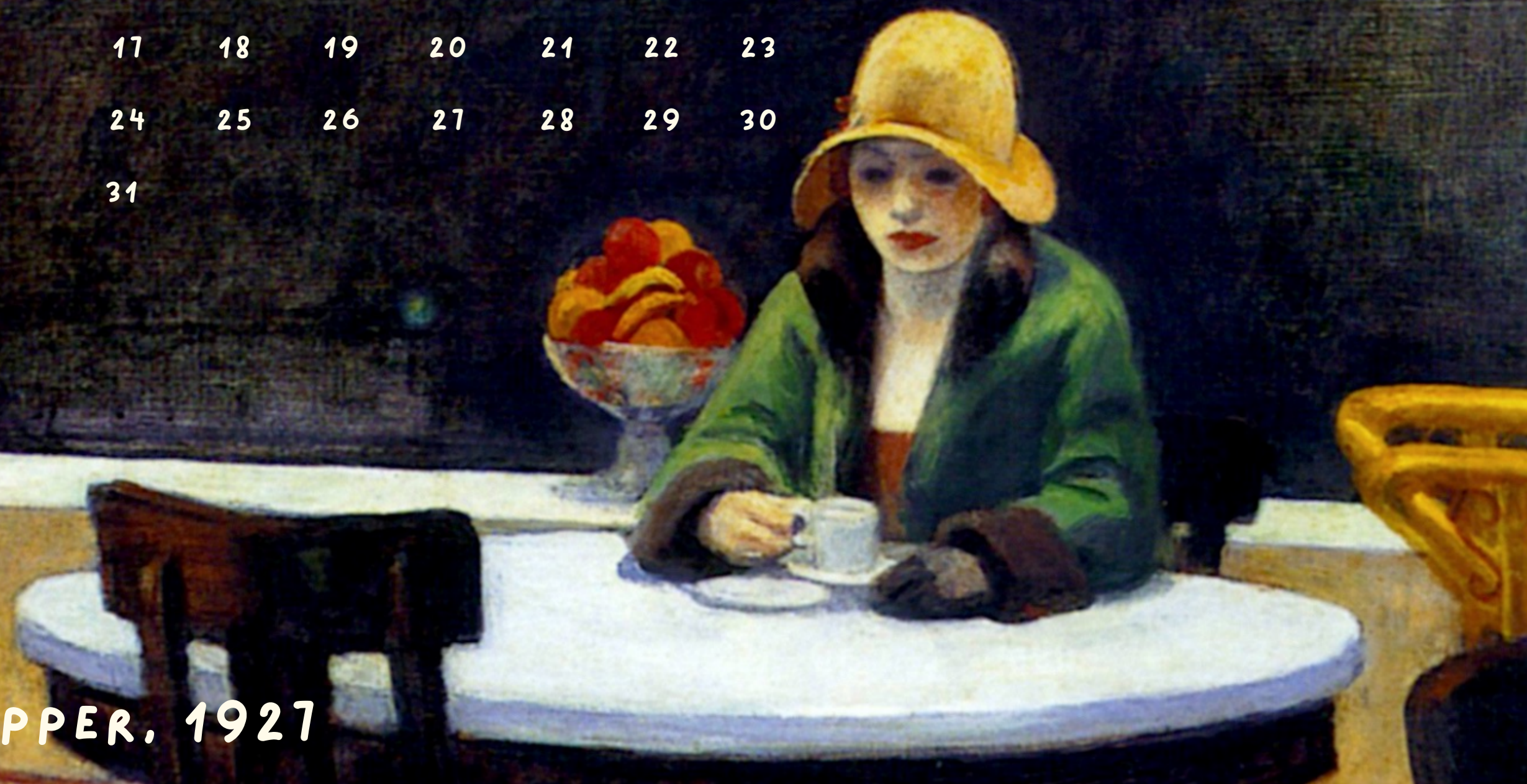
LA AUTÓMATA, EDWARD HOPPER, 1927